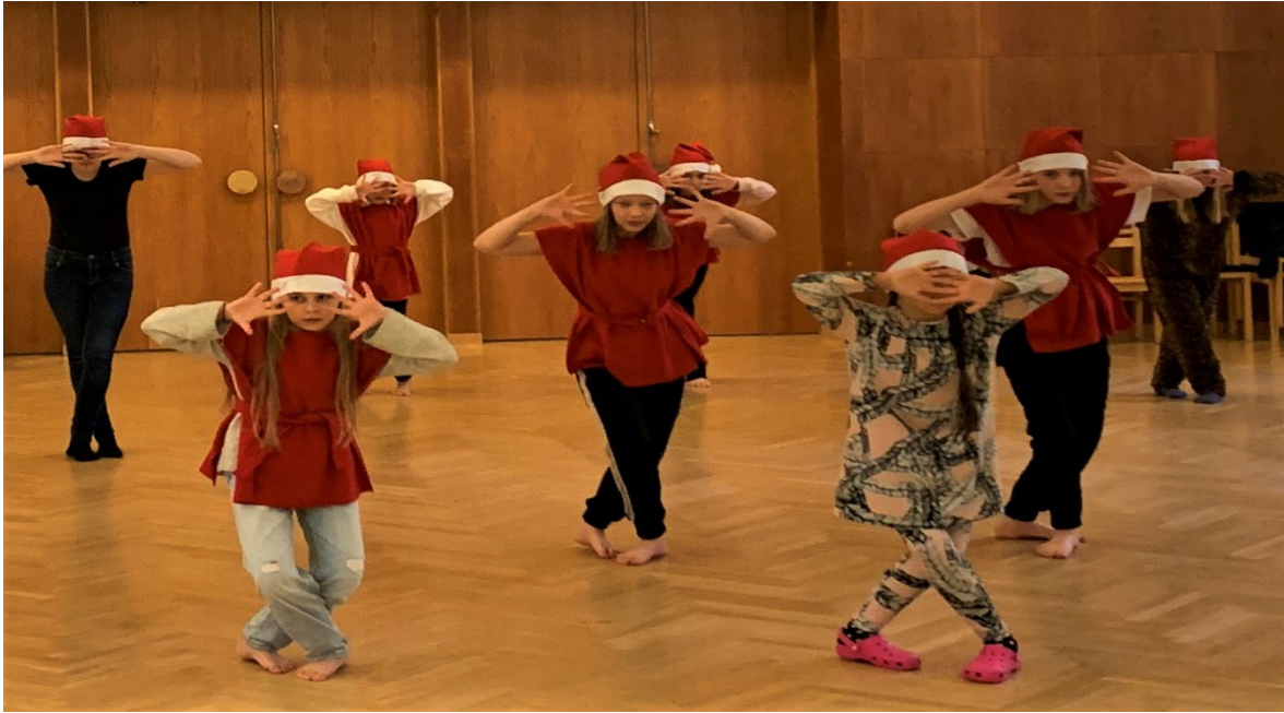
Laulua kuonoon, joulua tassuun kuorolaisia ja orkesterilaisia marraskuu 2020