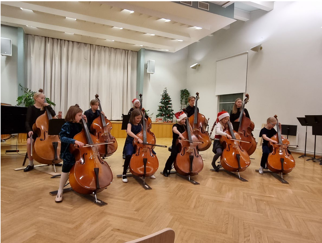
Kontrabassoryhmät jouluisissa tunnelmissa 14.12.2023