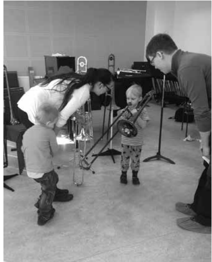
Soitinpolulla saattoi kokeilla kaikkia soittimia opettajien avustuksella.