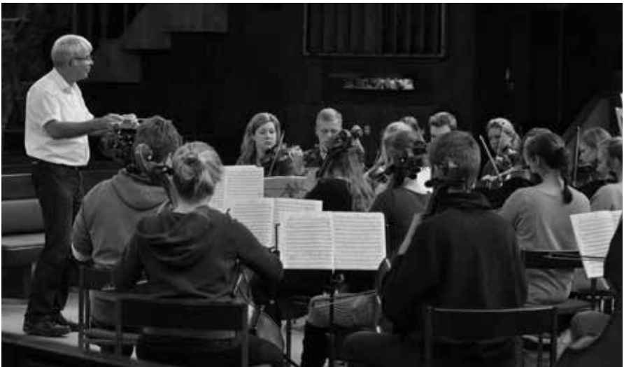
Ahrensburgin nuorisosinfoniaorkesteri Tempeliaukion kirkossa.