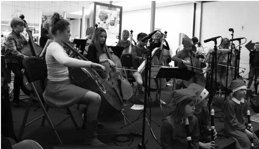
Kauppakeskus Itiksen joulun avajaiset